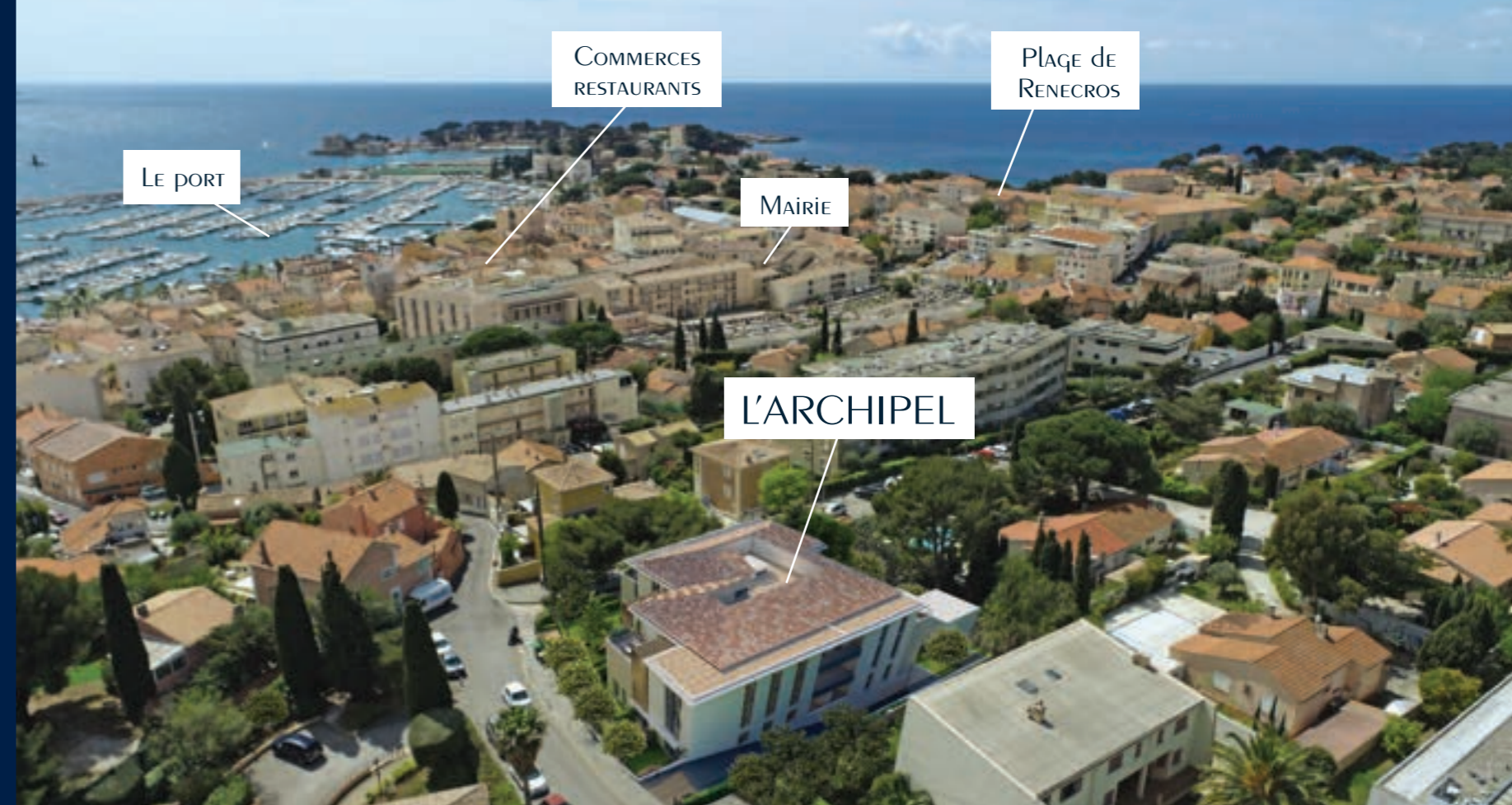
Vue sur la résidence

A l'écart de l'effervescence, à deux pas de toutes les commodités, dans un cadre naturellement paisible, vous découvrirez tous les bienfaits de cette Résidence à taille humaine.