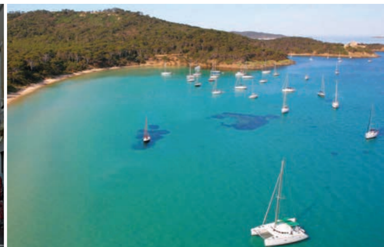
La côte et les plages